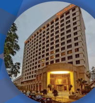
هتل پانوراما کیش