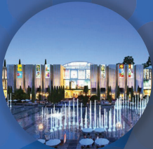
بازار بزرگ ایران مال