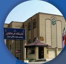
دانشگاه شهید رجایی شیراز