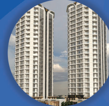
برج های تریتیوم