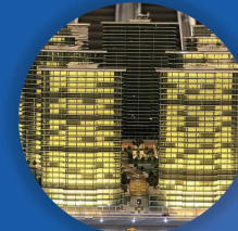
مجمع قوه قضاییه چیتگر

لیست برخی از مشارکت ها در پروژه های عظیم کشوری